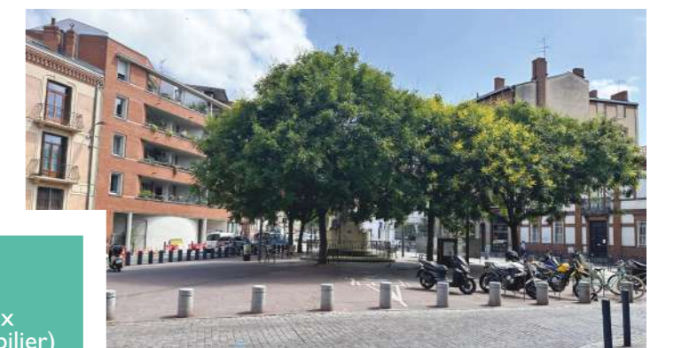
La place aujourd'hui.

(1) Castine : revêtement de calcaire, qui se solidifie avec le temps et peut être balayé. (2) Avant le 27 septembre, participez à la concertation sur le réaménagement de la place Jeanne d'Arc sur le site de Toulouse Métropole.