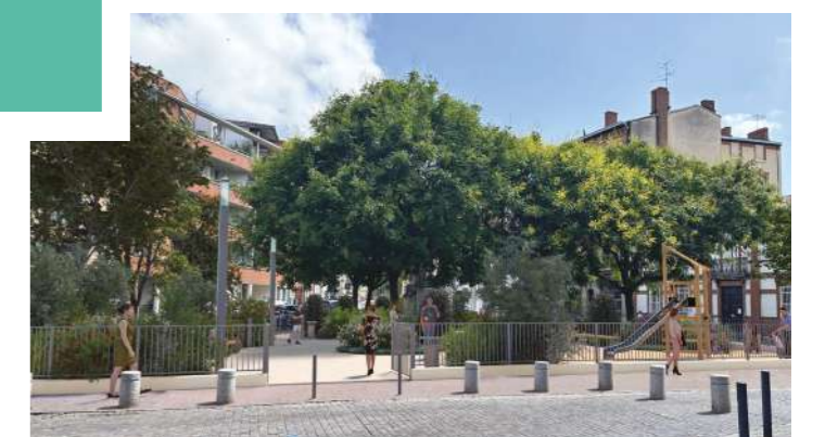
La place demain.