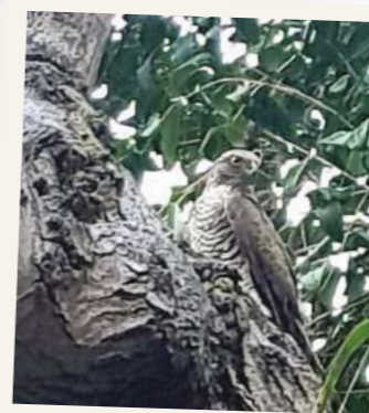
UN ÉPERVIER D'EUROPE. Carnivore, il s'attaque aux pigeons.

Nos remerciements à Laurent Bessol, photographe professionnel, dont nous avons dressé le portrait dans la Gazette n°116. Certaines de ses photos ont été réalisées expressément pour cet article. Merci également aux photographes amateurs pour leur envoi : Sandra Schmidt (épervier), Caroline G. (écureuil) et Jeanie Pezet (nid). Pour ceux qui voudraient aller plus loin dans la connaissance de la faune sauvage, mais aussi de la flore, nous conseillons vivement la lecture du très beau livre « Toulouse, la nature au coin de ma rue », rédigé par les équipes du Muséum d'Histoire Naturelle. Édité par la Ville de Toulouse, vous le trouverez en vente, entre autres, au Muséum.