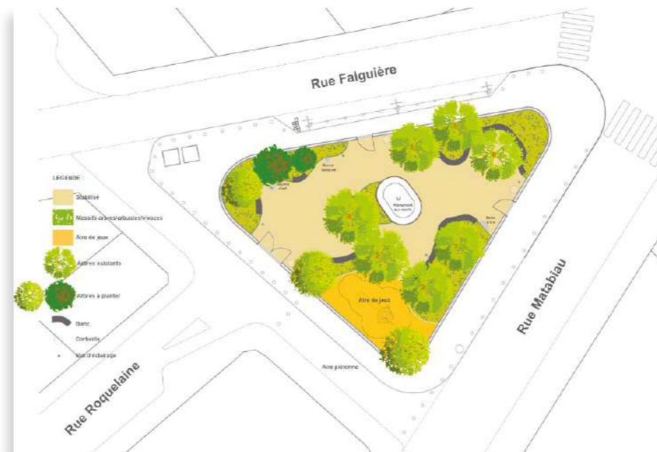
Plan d'aménagement de la future place.