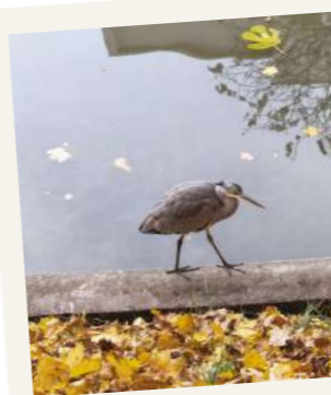
UN HÉRON CENDRÉ