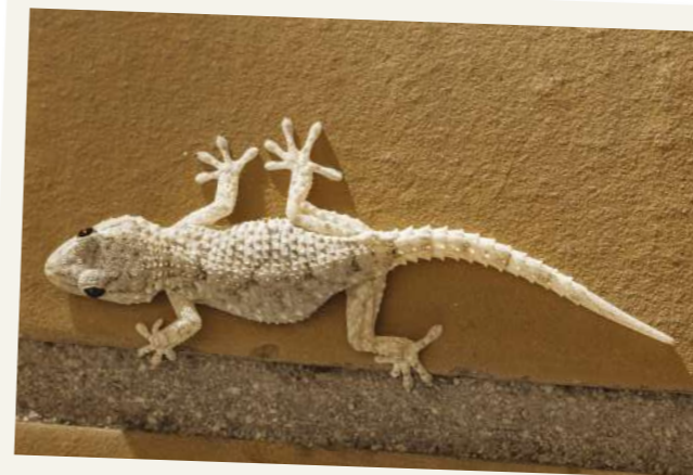
UNE TARENTE OU GECKO Ses ventouses sous les pieds lui permettent de se déplacer facilement sur les surfaces verticales comme les vitres ou les murs.