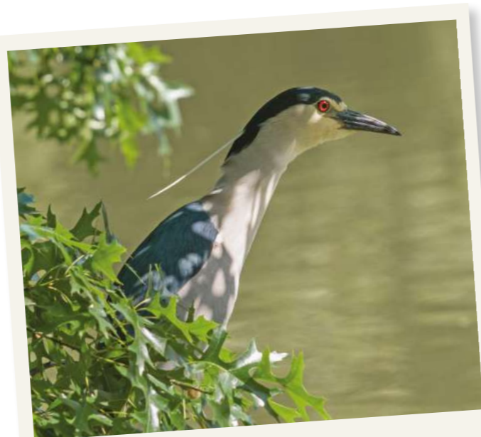
UN HERON-BIHOREAU GRIS