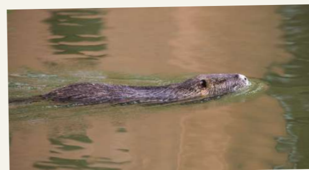
UN RAGONDIN DANS LE CANAL DU MIDI