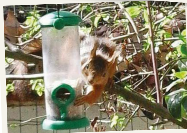
UN ÉCUREUIL En visite rue Ingres; où peut-il bien nicher?