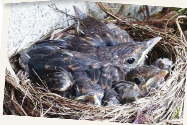
UN NID DE MERLES, RUE INGRES. Une pensée émue pour les oiseaux qui avaient, il y a quelques années, construit leur nid dans une des boîtes à lettres de la maison de quartier.