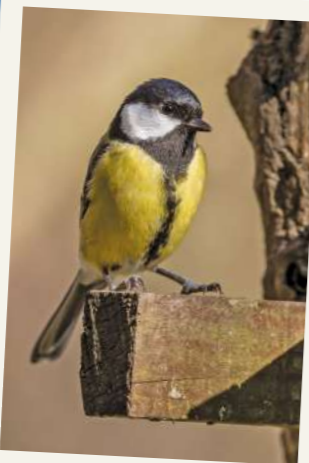
UNE MÉSANGE CHARBONNIÈRE