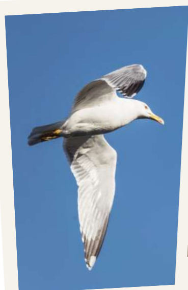
UN GOËLAND LEUCOPHÉE

Voici quelques photographies prises dans le quartier.